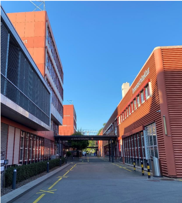
Bild 2 Laborgasse mit Tageslicht und Sonneneinstrahlung

In der Nacht ist die Gasse nur spärlich, unregelmässig und mit unterschiedlichen Lichtquellen beleuchtet.