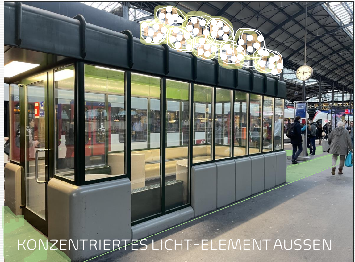
KONZENTRIERTES LICHT-ELEMENT AUSSEN