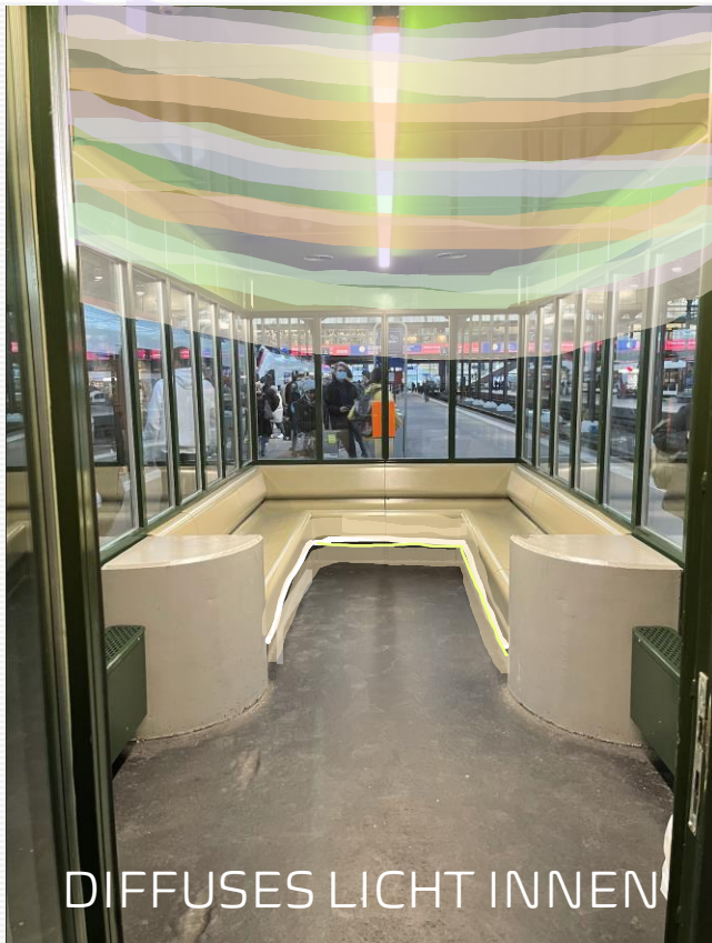
DIFFUSES LICHT INNEN