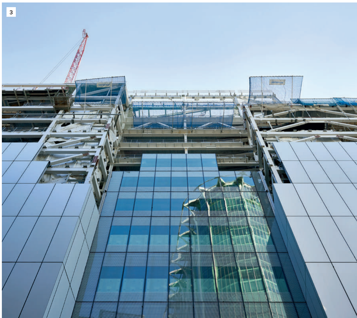
3 Nordfassade 21 Moorgates mit Reflektion des CityPoint Gebäudes. Standardelementgrösse 1,5×4 m und 3×4 m mit maximalabmessungen von 3×8 m, Josef Gartner GmbH

Seit mehreren Jahren bin ich auch vorwiegend für Londoner Projekte engagiert. Es ist überwältigend, wenn man dann schon beim Anflug der Metropole aus der Luft sein Schaffen wiederfindet.